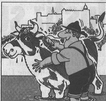
Arabische Gäste in Zell/See: Von