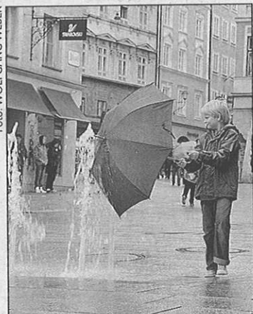
Kalte Dusche für Linzergasse