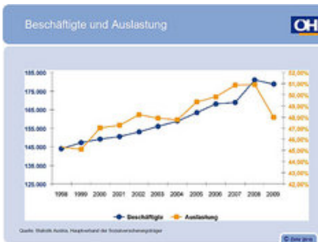
BILD zu TP/OTS - Beschäftigte und Auslastung