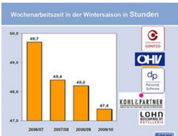
BILD zu TP/OTS - Wochenarbeitszeit in der Wintersaison in Stunden